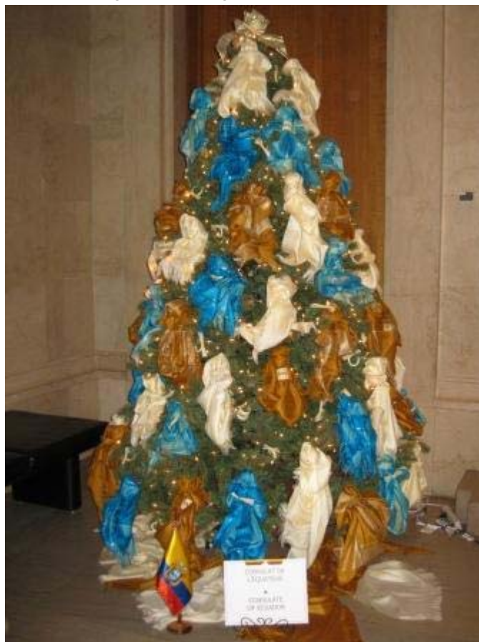
Árbol de Navidad presentado por el Consulado General del Ecuador en Montreal en el Museo de Bellas Artes.