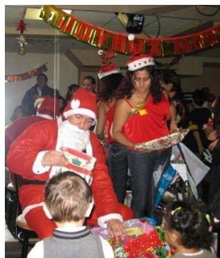
Papá Noel entregando regalos a los niños

El sábado 13 de diciembre se llevó a cabo la fiesta navideña organizada por la Asociación Ecuatoriana en Quebec, la que contó con el apoyo de este Consulado. Durante el agasajo, los niños realizaron una representación del nacimiento mientras los presentes entonaban villancicos. Además, hubo un concurso de dibujo infantil y entrega de regalos a los niños y niñas de nuestra comunidad, se rifaron canastas navideñas y se disfrutó de platos típicos de nuestro país elaborados por los asistentes.