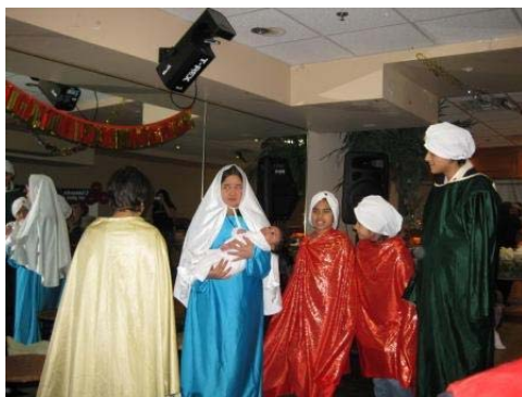
Representación de pesebre