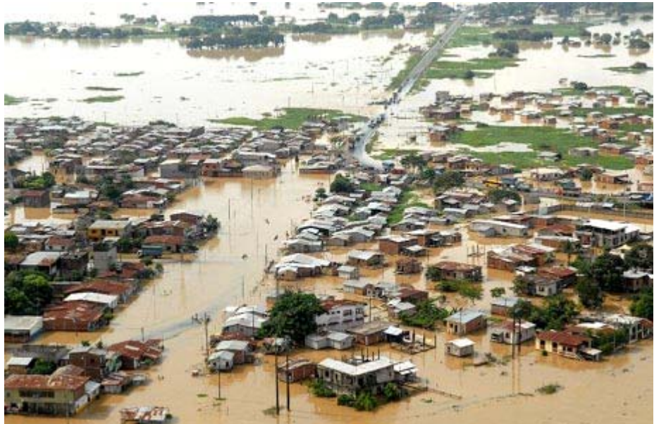
Panorama actual de Babahoyo, capital de la Provincia de Los Ríos

El Consulado General del Ecuador en Montreal hace un llamado de solidaridad en favor de los tres y medio millones de afectados y 265.000 compatriotas evacuados como consecuencia de las devastadoras inundaciones de la intensa estación invernal, que afecta actualmente a nuestro país.